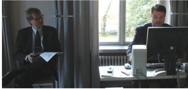
Tutkijataustainen puheenjohtaja vaati paremmin tilannetta kuvaavan graafin (emme ole ketään huijaamassa) ja sellainen onneksi myös löytyi.

Neuvoston suunnittelijan valmistelemista kalvoista lähti melkein puolet pois puheenjohtajien käsittelyssä Fabianin kokoushuoneessa aamulla ennen ministerita- paamista